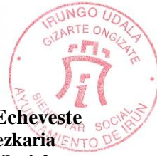
Stua. / Fdo.: Iosu Iguñiz Echeveste Gizarte Ongizteko Ordezkaria Delegado de Bienestar Social